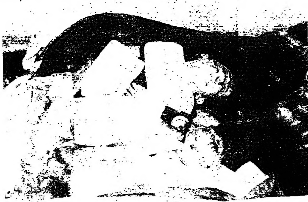
طلال استشهدوا في «مخيم البرغلة»